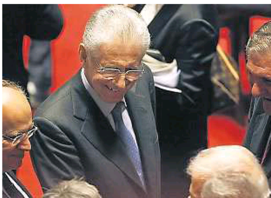
Mario Monti, ayer en el Senado de Roma

Más información en la Sección de Internacional