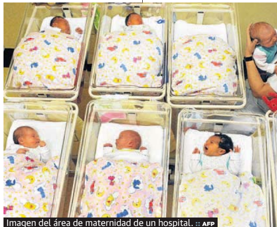
Imagen del área de maternidad de un hospital.